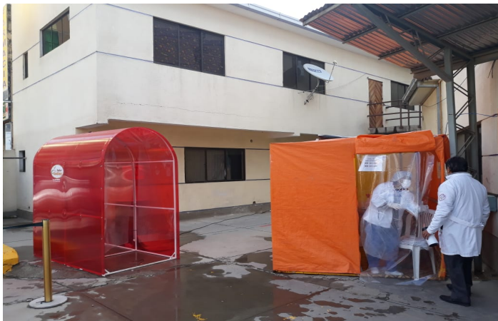
ÁREA DE TRIAJE