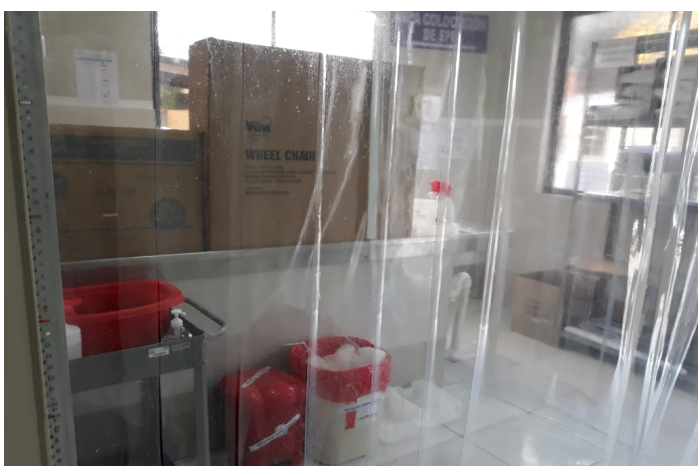
ÁREA DE VESTUARIO MÉDICO